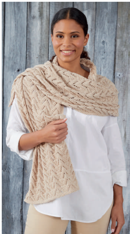
SIMONA S11115 | Booklet Alva Silk