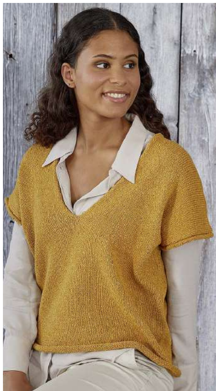
SELIA S11113 | Booklet Alva Silk