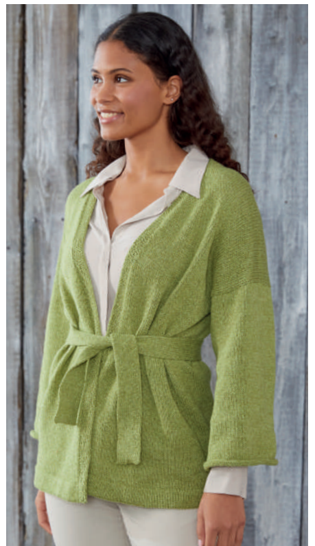
SELINA S11112 | Booklet Alva Silk