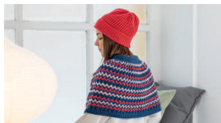
JONA S10931 | Booklet Soft & Easy