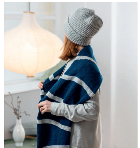
JAMIE S10932 & JULE S10930 | Booklet Soft & Easy