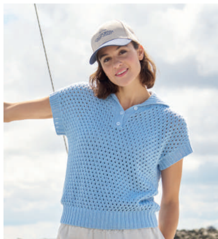
JARA S11295 | Magazin 047 Summer Trends