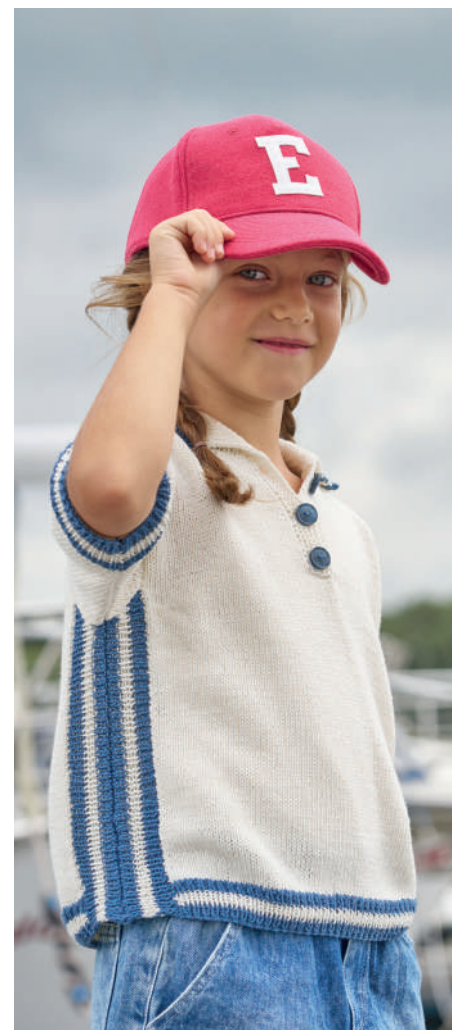
TAINA S11296 | Magazin 048 Get ready for summer