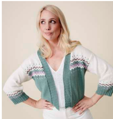
ESTIA S11185 | Webdesign