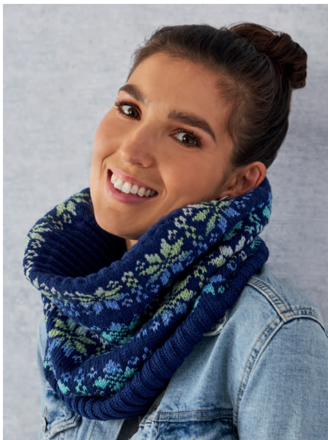
ZENTA S11201 | Webdesign