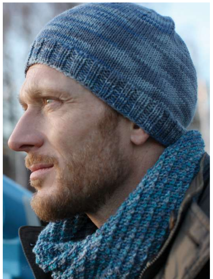
HERRENMÜTZE UND LOOP | Webdesign