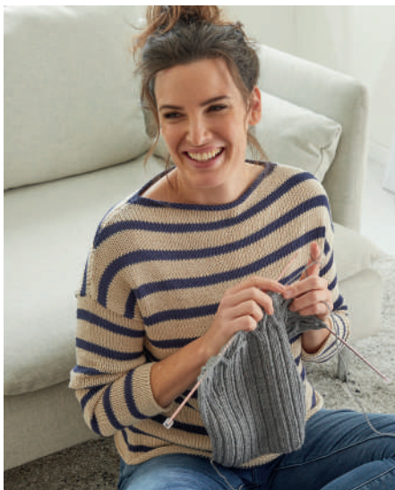
MONIKA S10362 | Webdesign