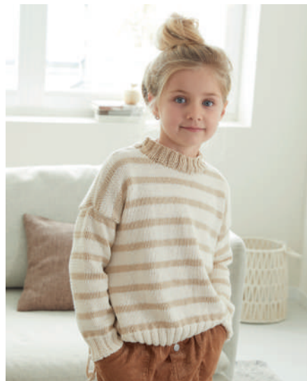
VALENTINA S10367 | Booklet Punto Kids