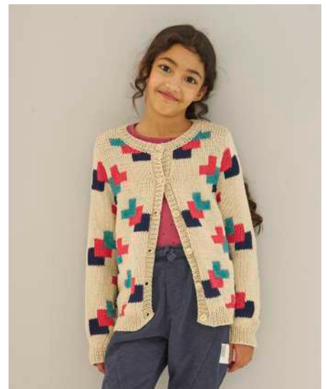
CLEA S11252 | Magazin 046 Back2school