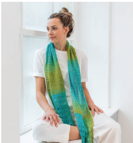
LOTTA S10879 | Booklet Tahiti