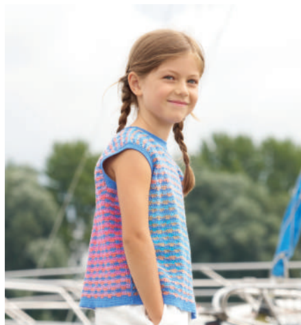
SHASA S11306 | Magazin 048 Get ready for summer