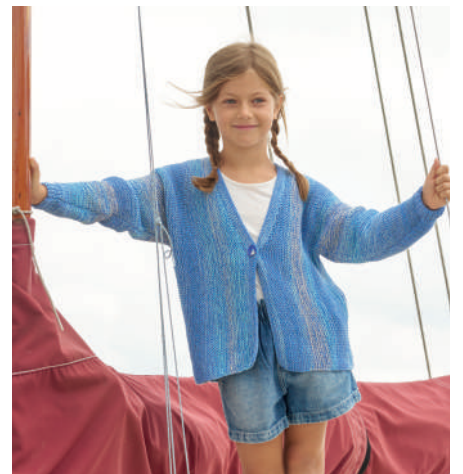
VENESA S11308 | Magazin 048 Get ready for summer