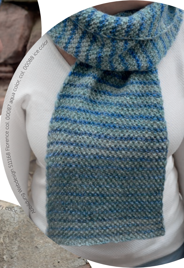
Abbildung Webdesign S11168 Florence col. 00087 aqua color, col. 00088 ice color