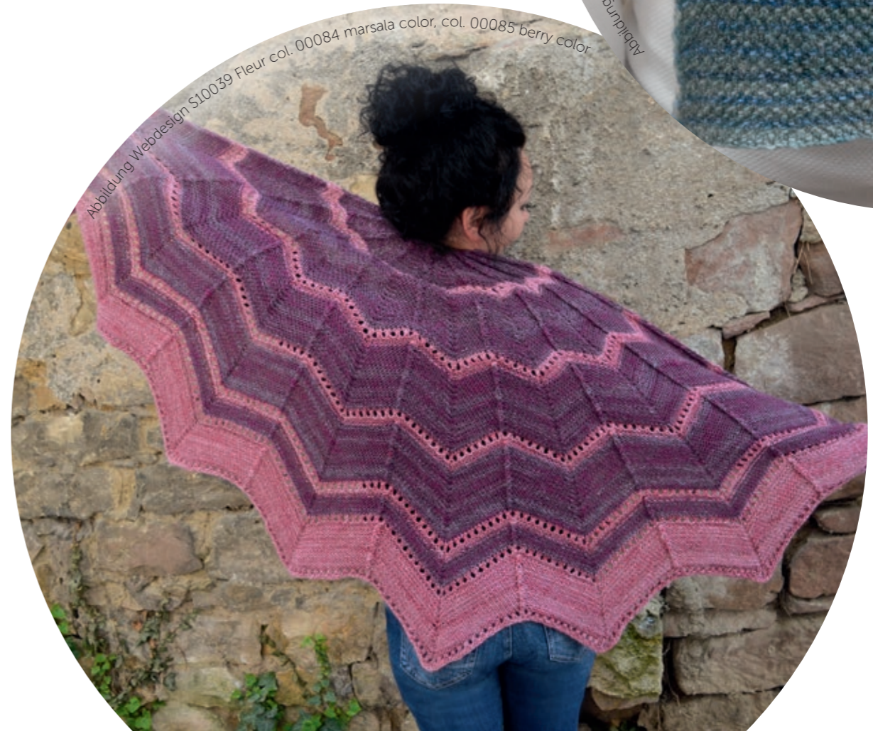
Abbildung Webdesign S10039 Fleur col. 00084 marsala color, col. 00085 berry color