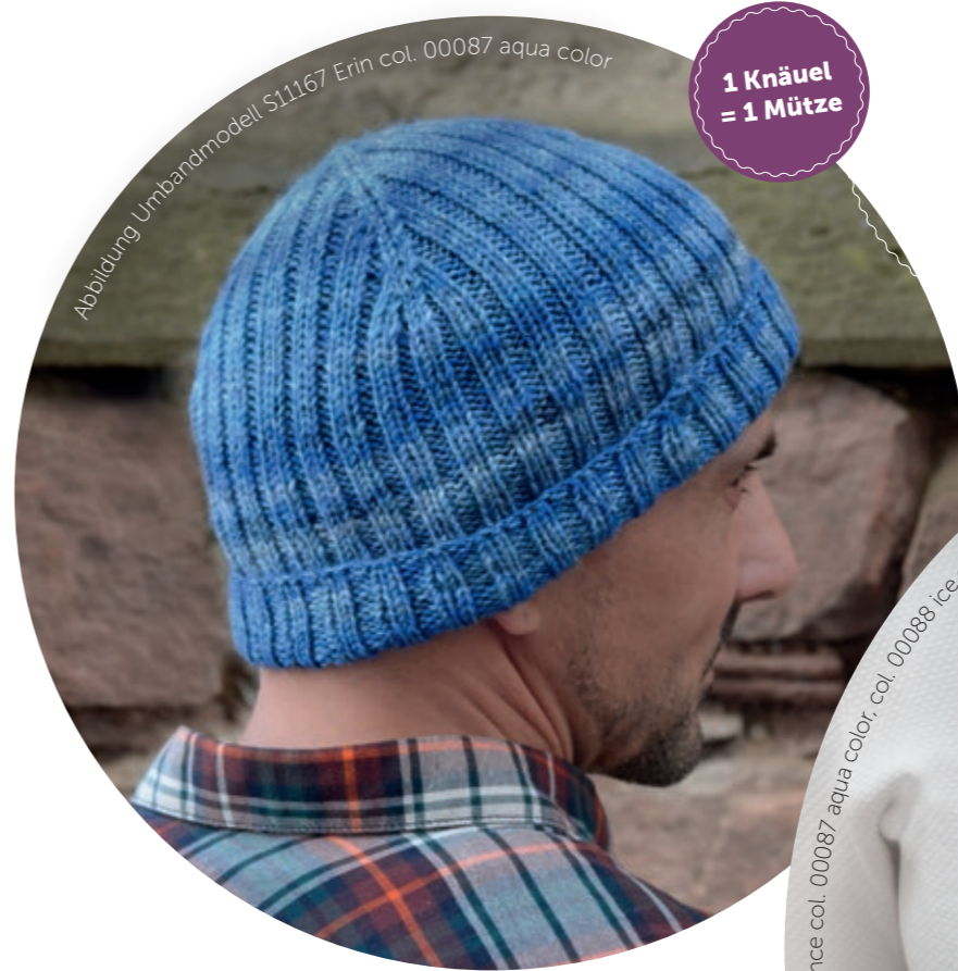
Abbildung Umbandmodell S11167 Erin col. 00087 aqua color