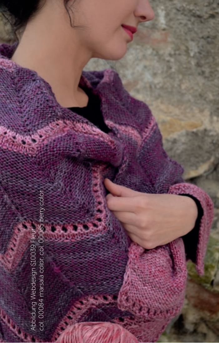
Abbildung Webdesign S10039 Fleur col. 00084 marsala color, col. 00085 berry color